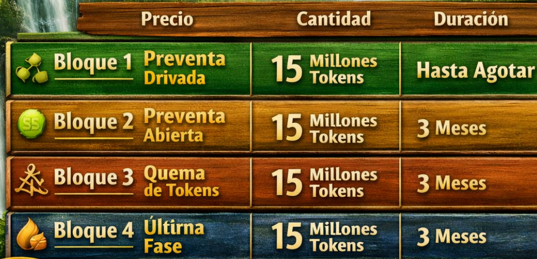
TABLA DE PREVENTA FSTCoin